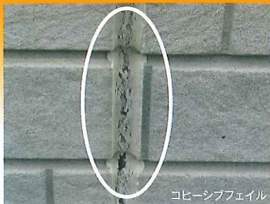
コヒーシブフェイル